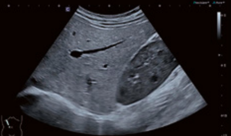
aufgenommen mit Aplio flex